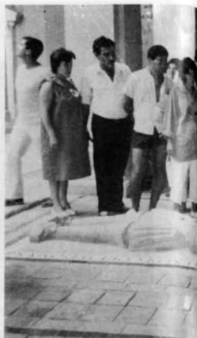
Visita al palacio de Viso del Marqués