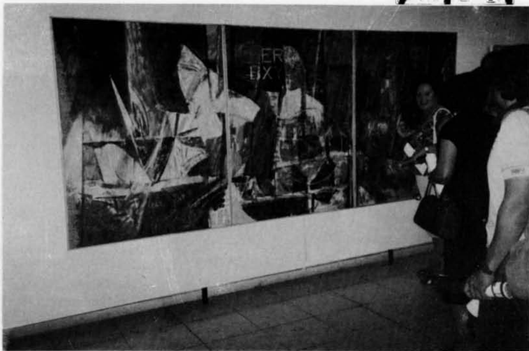
Visita a la Exposición Nacional de Artes Plásticas de Valdepeñas