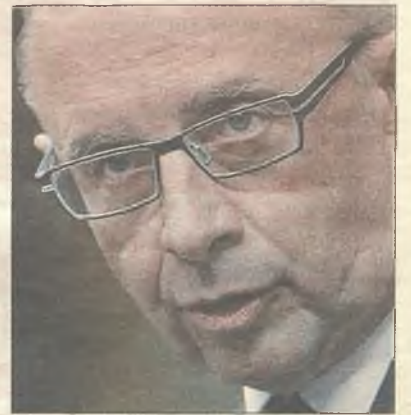
Arriba, una imagen exclusiva del agujero del déficit. Abajo, las caras que pusieron Mariano Rajoy, Soraya Sáenz de Santamaría y Cristóbal Montoro cuando conocieron la desviación de la cifra de déficit hasta el 8%