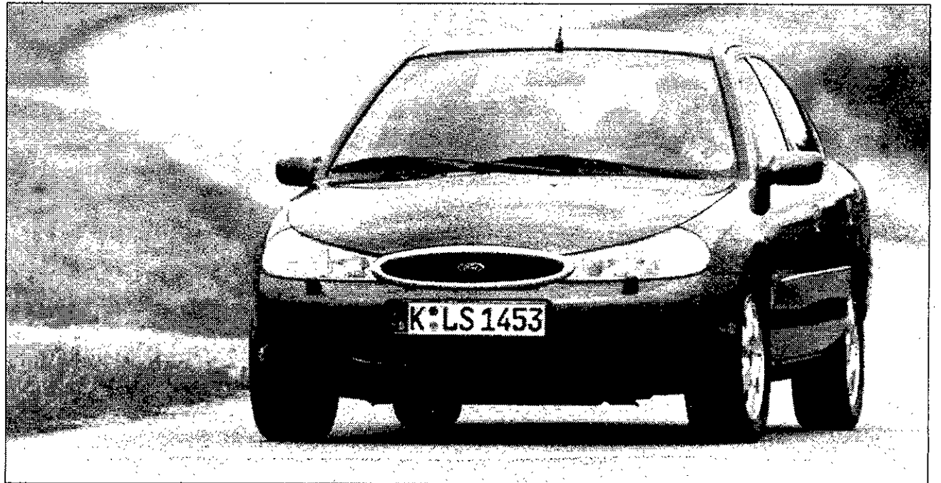
Los grupos ópticos traseros, de enormes dimensiones, han provocado un gran cambio en la estética.

Aunque su configuración sigue siendo plenamente actual, Ford adaptará el Mondeo a las nuevas exigencias del mercado. El que fuera Coche del Año en el 94, irrumpirá en el 97 con estética y seguridad renovadas