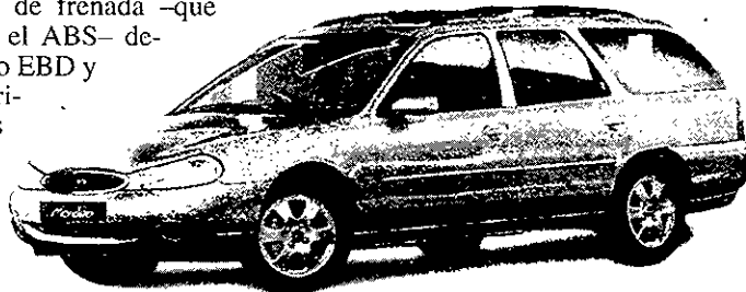
El Break ha experimentado también una considerable renovación.

los dos trenes incrementando la adherencia.