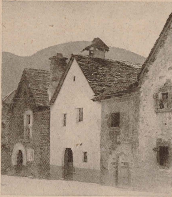
Cubiertas en Ansó.

cha tierra y poca cal), y en algunos casos de sillería. La dimensión mínima en espesor es de 60 centímetros, llegando en algunos casos a 90 centímetros.