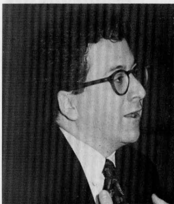
Luis Antonio de Villena.

ro uno en ventas, —según el diario El País — por su novela Las edades de Lulú , nació en Madrid en 1960. Tras cursar el bachillerato en el colegio de los Sagrados Corazones, estudió en la facultad de geografía e historia de la Universidad Complutense. Su trayectoria profesional se ha desarrollado siempre en el campo editorial, donde ha desempeñado diversos trabajos. Las edades de Lulú , obtuvo el XI Premio «La sonrisa vertical». Te llamaré Viernes , su segunda novela aparecida en fechas no muy lejanas, está consiguiendo una importante acogida por parte de público y crítica.