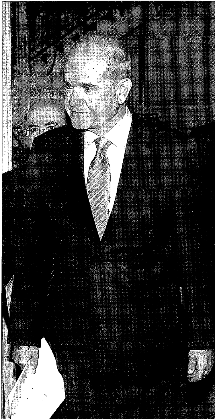
El vicepresidente tercero del Gobierno, Manuel Chaves, ayer en Madrid.

Ya en referencia exclusiva al principal partido de la oposición, Mato prometió que la formación de Génova buscará «la fórmula para que, en cualquier momento, si sobre una persona recae una acu-