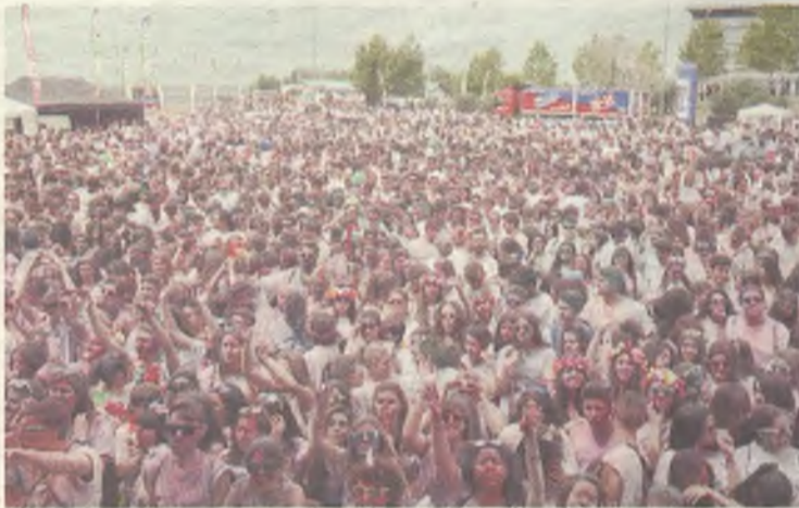
Todos los participantes se concentraron en el nuevo Recinto Ferial

En los cinco kilómetros de recorrido se habilitaron hasta tres