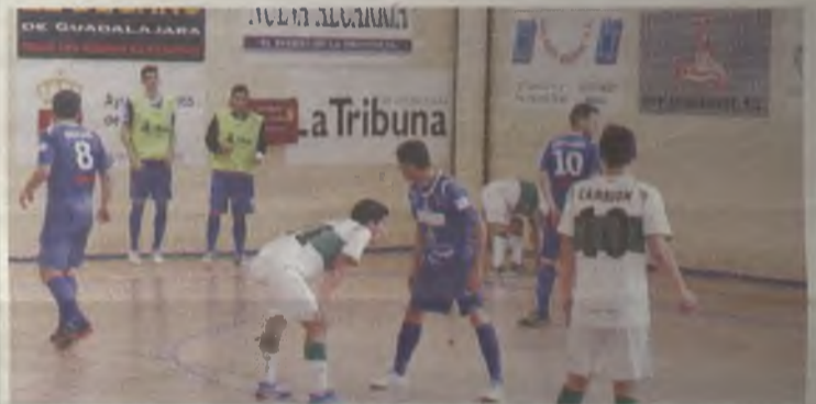
Primera victoria del Brehuega al Elche.