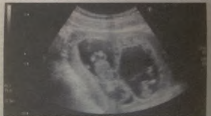
Los dos pequeños, en la tripa de su madre.

La última ecografía ha desvelado que serán padres de gemelos