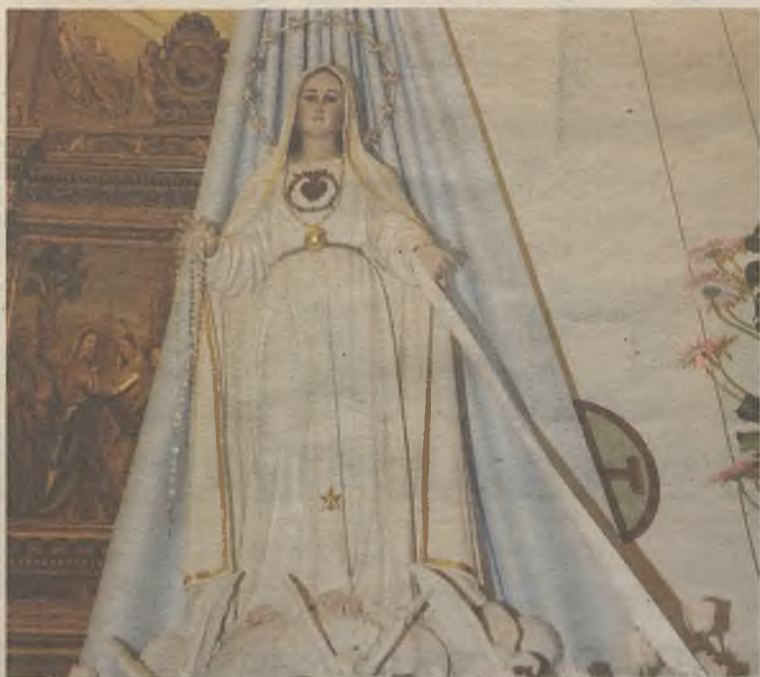
La Virgen de Fátima en la Concatedral.

La Concatedral de Santa María acoge una talla realizada en 1945 orientada por sor Lucía, a quien se le apareció en 1917