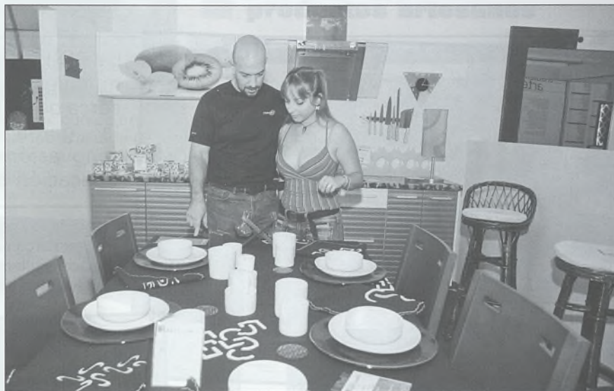
El mueble de Sonseca ha tenido la virtud de adaptarse a las nuevas tendencias sin perder su calidad ni su saber hacer tradicional. Arriba, recreación de una moderna cocina y comedor, vestido con textil de diseño y vajilla contemporánea. En la imagen inferior, propuesta de cocina de Idea Hogar.

La forja, combinada con la madera, vuelven a ser pareja de éxito en las propuestas que se pueden ver en Farcama. □