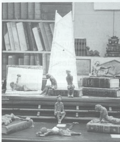
Hay detalles que embellecen una estancia, como estos sujetalibros que firma el taller 'En Babia'.

incorporar diseño a sus tradicionales virtudes de calidad y buen hacer artesanal. Y en estos tiempos de crisis también ofrece precio. Hemos visto en la feria un dormitorio completo que firma Ferpi por 399 euros, o una composición modular para un salón por 396 euros.