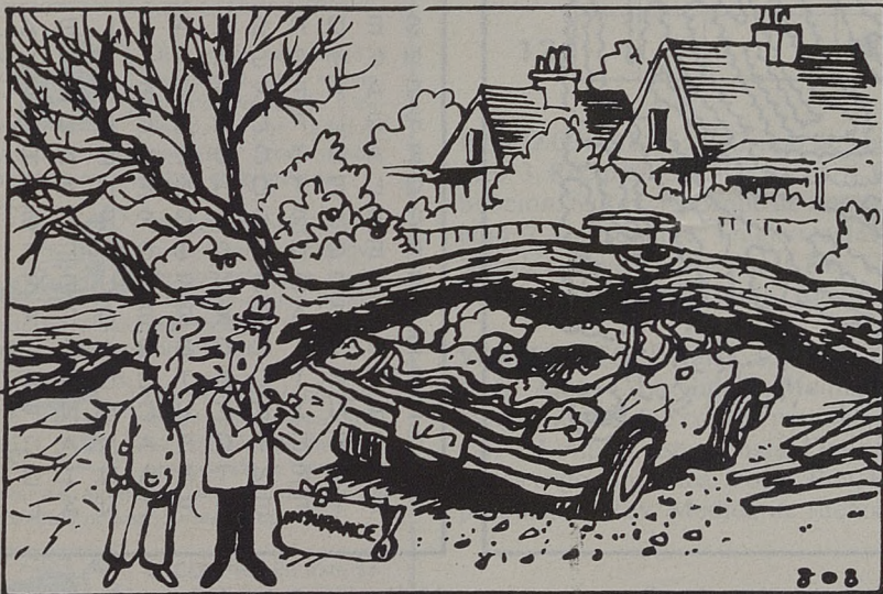
¿Y dice Vd. que el árbol lo cortó el cura? Pues lo siento porque la póliza no cubre los daños de Dios.