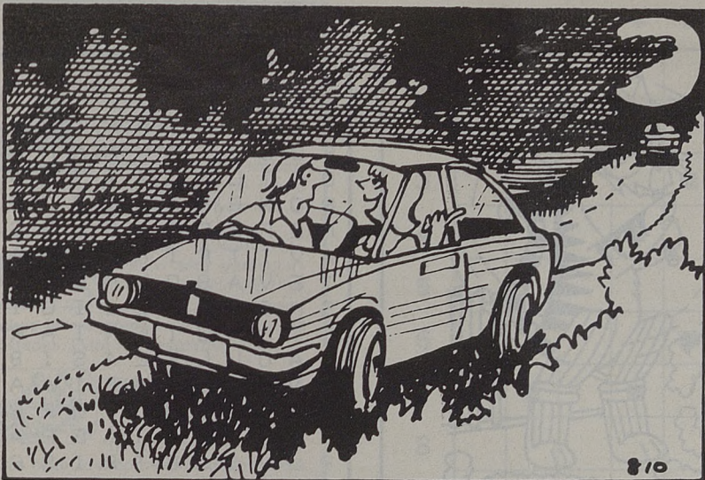
¿Nos hemos quedado sin gasolina? No importa, yo me voy con mi padre que nos viene siguiendo.