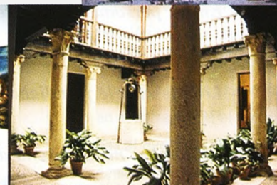
Casa natal de Miguel de Cervantes. En la actualidad convertida en museo.