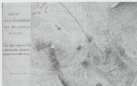
Fig. 33. Plano el castillo de Gaucín