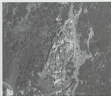
Fig. 35. Castillo de Castellar

con tres recintos amurallados (fig. 33). El acceso al recinto exterior se realiza por dos puertas. La puerta principal está formada por dos arco de ladrillo, uno apuntado y con saeteras y otro de medio punto con alfiz enmarcado. Hay otra puerta situada en el lado norte que es muy parecida a ésta y cuenta también con saeteras.