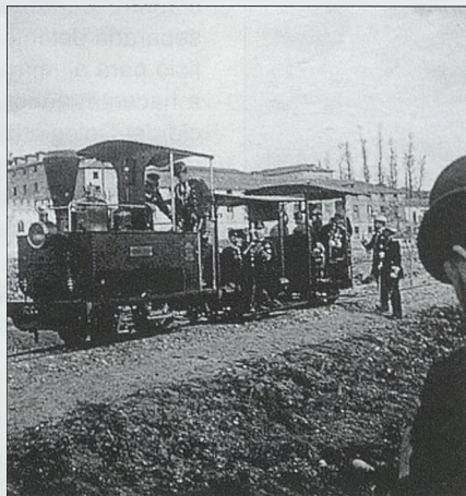
Visita Real y trenecillo de la Academia

Según García Bodega el primer palacio mendocino fue el núcleo central que se mantuvo durante la historia del edificio. Imponía su jerarquía mediante el añadido de cuerpos largos, ortogonalmente dispuestos formando patios y corralones, de forma muy compleja y extendida. Ello se hará mediante constantes obras de acondicionamiento, mejora y ampliación del conjunto. Sin embargo, y es una conclusión interesante, resulta