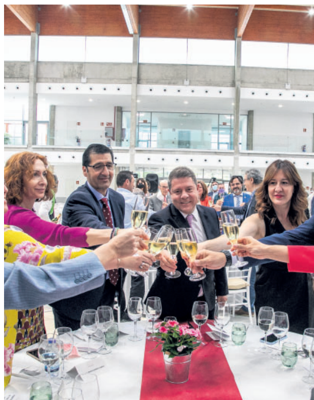
Inauguración de la nueva fase del pabellón ferial

La primera parte del proyecto abierta hoy ante toda la sociedad de la provincia ha costado menos de cuatro millones de euros, y se ha centrado en el patio del antiguo pabellón, ahora cubierto. Podrá acoger