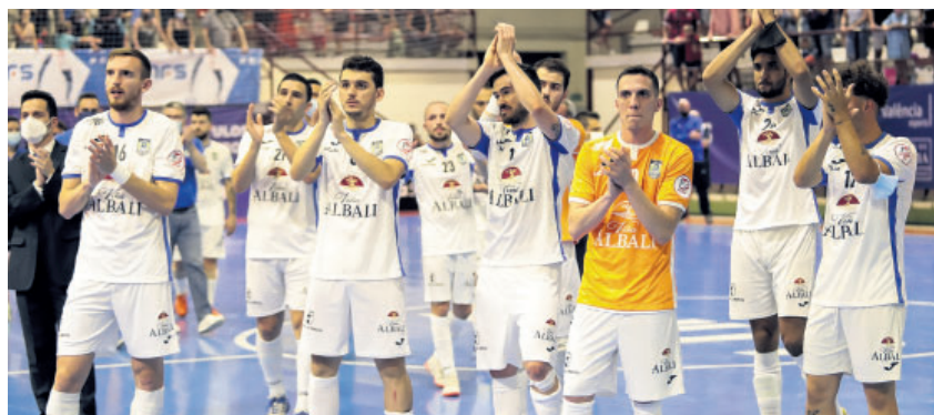
Los jugadores de Viña Albali tras su último partido de la temporada