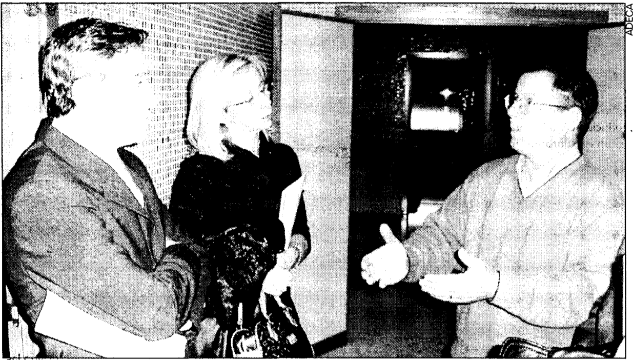
EMPRESARIOS DE LOS POLIGONOS DE ROMICA Y CAMPOLLANO UNEN SUS INTERESES.