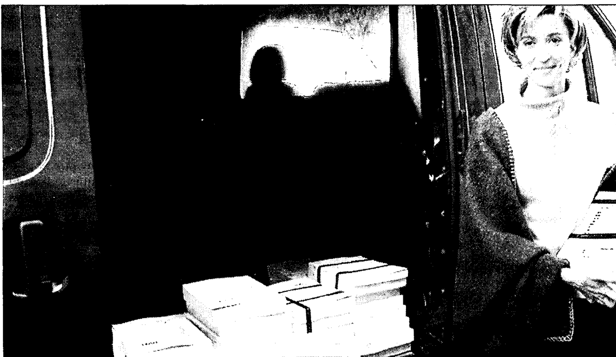
LA CONSEJERA DE ECONOMÍA HA PRESENTADO LOS PRESUPUESTOS PARA EL 2001.