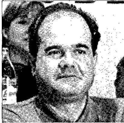
MANUEL CHAVES Presidente de la Junta.

El ministro de Economía, Rodrigo Rato, manifestó que "es un buen día para la sanidad pública española". Según el vicepresidente segundo del Gobierno, "van a salir todos los territorios beneficiados".