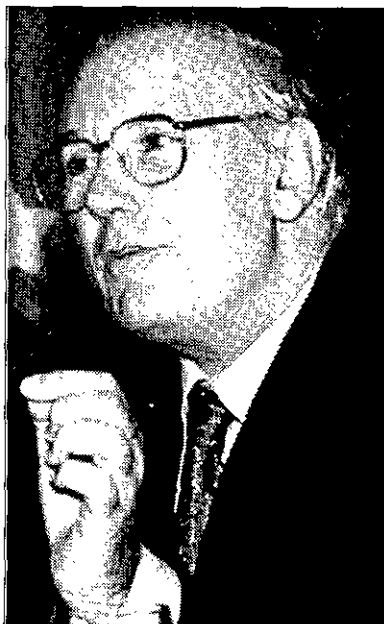
ROMAY BECCARIA Ministro de Sanidad.

cios sanitarios que percibe cada español. Mientras, la Federación de Asociaciones para la Defensa de la Sanidad Pública considera discriminatorio el reparto del fondo adicional que aprobó también el CPFF. En un comunicado, la FADSP también rechaza la exclusión de la financiación pública de algunos medicamentos, al entender que es una medida con escasa repercusión económica, "ya que va a producirse un desplazamiento de la prescripción hacia otros medicamentos más caros". Por su parte, los médicos han manifestado su desconcierto ante el nuevo modelo, en el que "no se ha consultado a los verdaderos expertos y profesionales en la materia", según señaló el presidente del Colegio Oficial de Médicos de Madrid, José Zamarrigo.