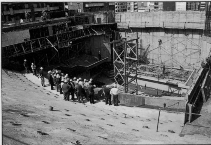
El anfiteatro - en la fotografía- contará con 622 butacas. Y el patio de butacas con 568 asientos.

En la cimentación del nuevo edificio se han invertido 161 millones de pesetas. La segunda fase del proyecto, que corresponderá a acabados e instalaciones, tiene un presupuesto inicial que ronda los 1.005 millones de pesetas, y que tendrá que ser financiado por las distintas administraciones. Por el momento, la Junta de Comunidades se ha comprometido a aportar 150 millones, y el Ministerio de Cultura aportará otros 25 millones de pesetas. ■