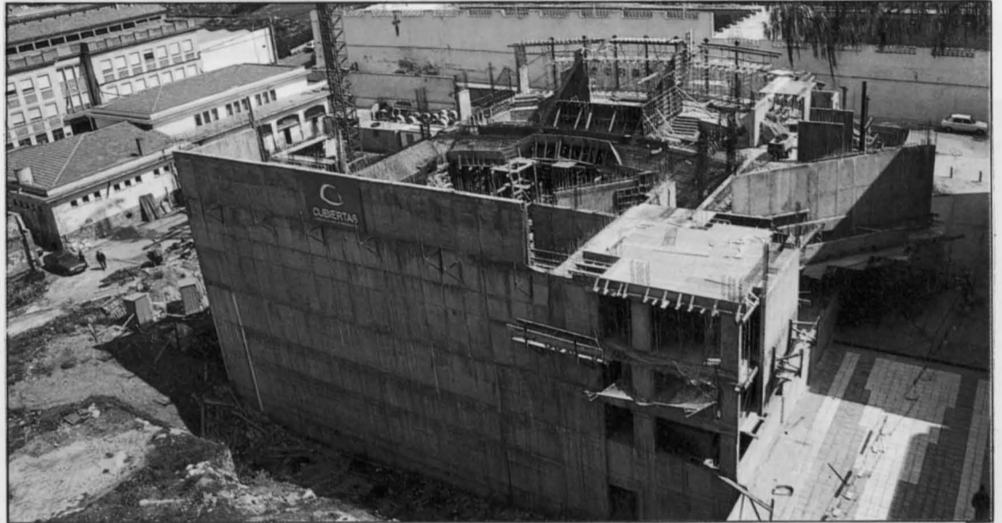
Vista general del Auditorio que será inaugurado a finales de 1994.

La construcción del Teatro-Auditorio es la gran obra que Puer-