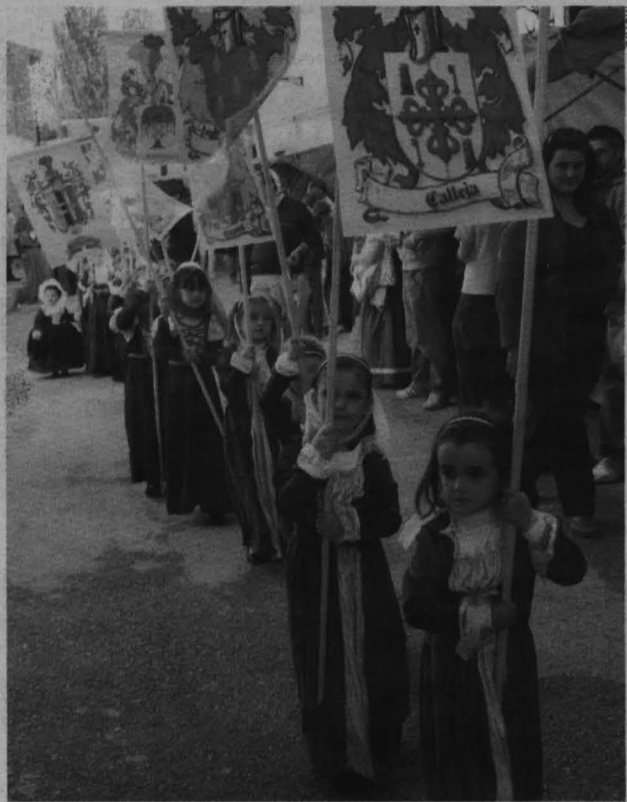
Una treintena de niñas, vestidas para la ocasión, protagonizaron un alarde heráldico que atravesó las calles de la localidad.

Tráfico Un muerto en las carreteras castellano-manchegas durante el fin de semana Un hombre de 79 años, que fue atropellado en Socuéllamos (Ciudad Real) el pasado viernes, es la única víctima mortal en las carreteras castellano-manchegas desde las 15.00 horas del viernes a las 20.00 de ayer domingo.