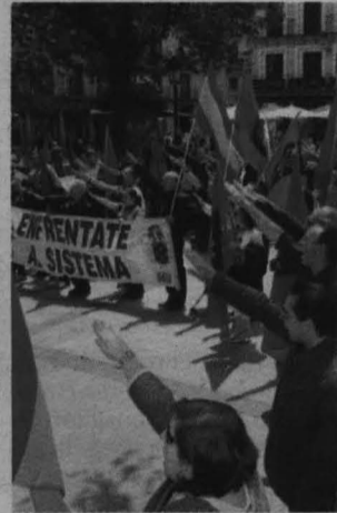
Momento de la concentración promovida por la Falange.