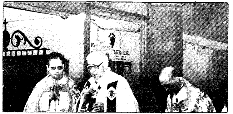
El Cardenal Marcelo González en un momento de su homilía en la plaza de Zocodover

entre el poder civil y la Iglesia, lo cual no obsta para que, como ciudadanos podamos presenciar cosas de nuestra tradición y de nuestra cultura». Sin embargo, el ministro reconocía que la postura del cardenal le parecía «un tanto dura», pero que no les había condicionado en absoluto como ciudadanos para aceptar la invitación de sus compañeros del Ayuntamiento de Toledo para la asistencia al Corpus toledano. «Para que haya un conflicto -termina diciendo- las partes tienen que aceptarlo y el Gobierno no está en conflicto con el Cardenal en absoluto».