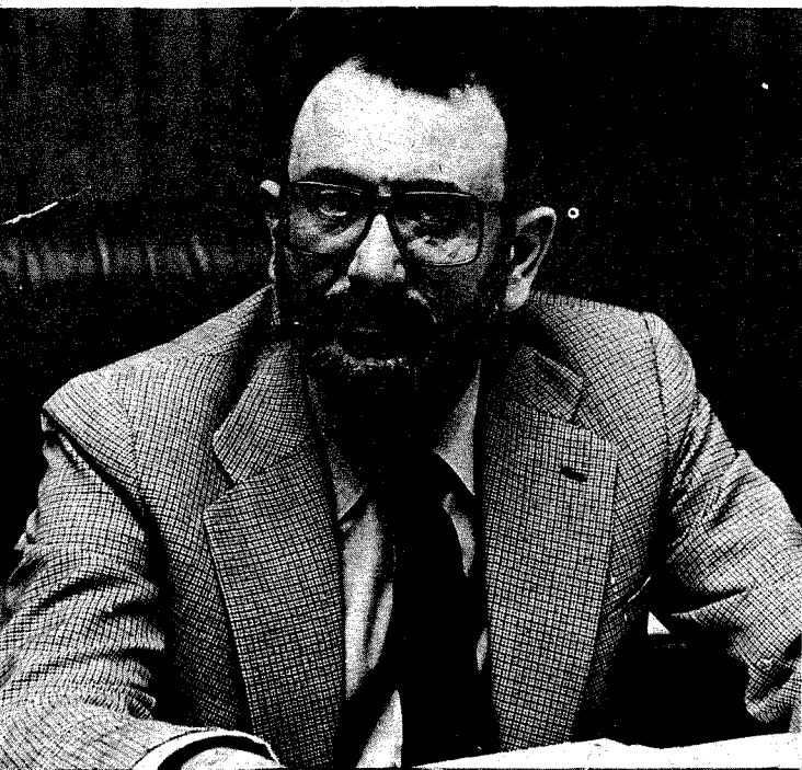
Julián Campo. Ministro de Obras Públicas.

Como se sabe, en enero de este año una disposición del Gobierno detenía las operaciones de trasvase en base a los informes técnicos que determinaban la existencia de unos caudales por debajo de lo estipulado por la Ley para proceder al trasvase de aguas de la cuenca del Tajo a la del Segura. De entonces hasta ahora se han venido sucediendo las protestas y manifestaciones de los regantes de la cuenca del Segura que ha ejercido todo su poder de presión sobre el Gobierno, hasta el punto de conseguir de éste la reanudación del trasvase el pasado 18 de mayo.