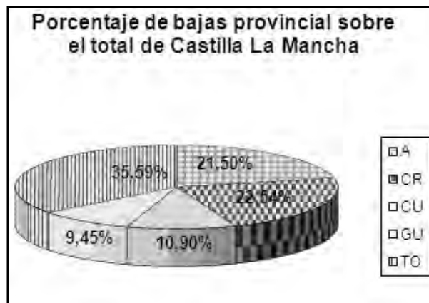
Bajas acumuladas de cada una de las provincias de la región.

Según los datos, provisionales, facilitados, recientemente, por el ministerio de Trabajo e Inmigración, el número de autónomos de la provincia de Guadalajara va a aumentar nuevamente, después de haberse visto reducido durante los meses de verano. La situación en