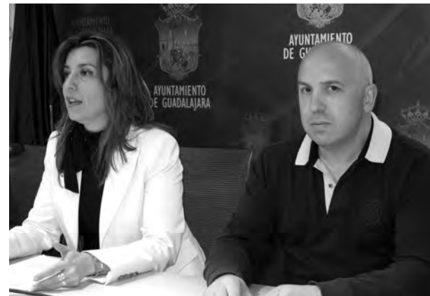
Se celebrarán los primeros jueves del mes, hasta septiembre./Marta Sanz

Ahora, viendo su respuesta sólo queda esperar que el cliente la siga y salgan a la calle, no sólo estos jueves, sino todos los días y así lograr "tener una Guadalajara muy comercial", como apuntó el presidente de FEDECO.