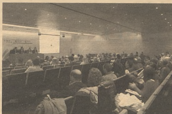
Los empresarios se mostraron muy interesados.