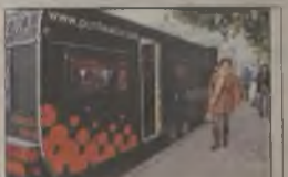
El sonido del valle Punto Radio Henares

Con motivo de la aparición del periódico DHenares , el programa 'Protagonistas' de Punto Radio Henares se hizo en directo, desde el estudio móvil de la emisora, en la céntrica plaza de Santo Domingo de Guadalajara. Las principales autoridades de la ciudad y la provincia no quisieron perderse la cita.