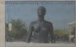
Lucha permanente Contra los maltratos

Un año más todos los ayuntamientos del Valle han promovido programas de ocio y divulgación por el Día de la eliminación de la violencia contra las mujeres. Lástima que la concienciación no baste contra esta terrible lacra.