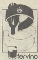
3 feria regional del vino castilla-la mancha

El cartel anunciador de la 3ª Feria Regional del Vino de Castilla-La Mancha ya ha sido lanzado hace unos días por la organización de este importante certamen ferial.