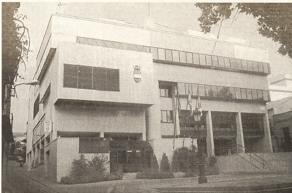
Ayuntamiento de Puertollano

El segundo de los capítulos planteados por UGT fue la protección social, el sindicato propone en líneas generales a los ayuntamientos que se mantengan y se aumente la partida destinada a las familias más desfavorecidas, e incluso que se incluyan partidas destinadas a la población inmigrante. En el tema de las pensiones, los representantes sindicales señalaron que desde su punto de vista, las pensiones deben estar bajo control de la caja única, aunque se congratulan de que se haya puesto de manifiesto que las