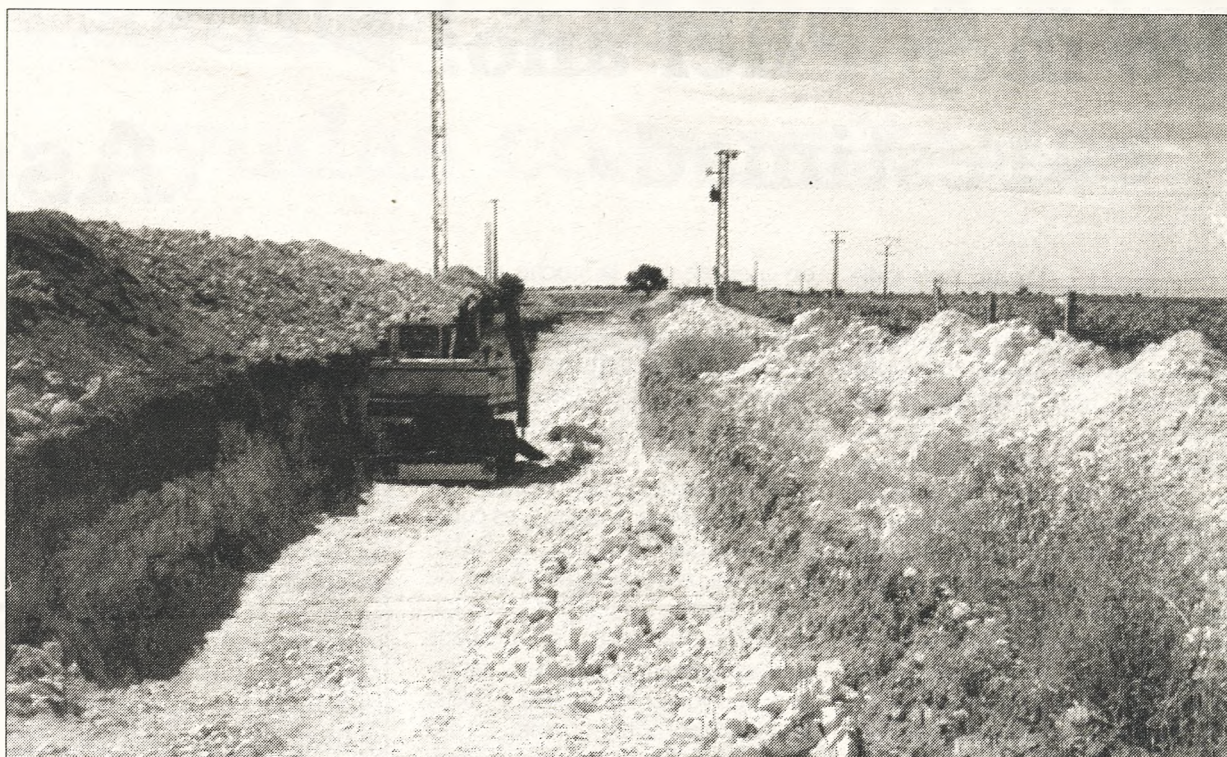
Uno de los criterios que se mantienen es que las obras deben contribuir a la mejora del medio ambiente, fundamentalmente en el ámbito urbano

La localidad de Piedrabuena también se beneficiará este año con cargo al Plan Operativo Local. En concreto, llegarán 150.000 euros para mejorar la red de abasteci-