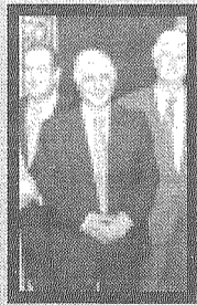
Día de la Región

do por calificarlos como “mal”. De “regular” ha sido calificado por 98 lectores, que viene a ser el 24% de los que han participado en la encuesta. Como se ve una opinión favorable a los actos de ese día.