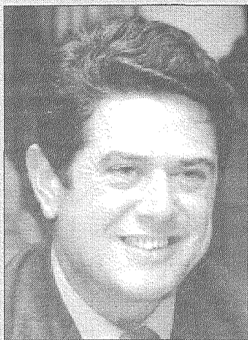
Federico Trillo, ex ministro de Defensa