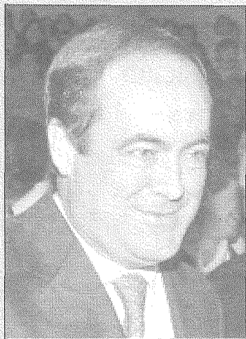
José Bono, ministro de Defensa de España