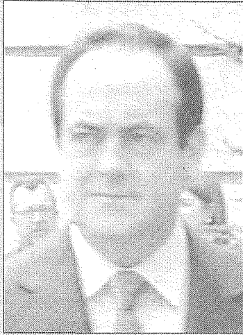
José Bono Martínez, ministro de Defensa del Gobierno de España