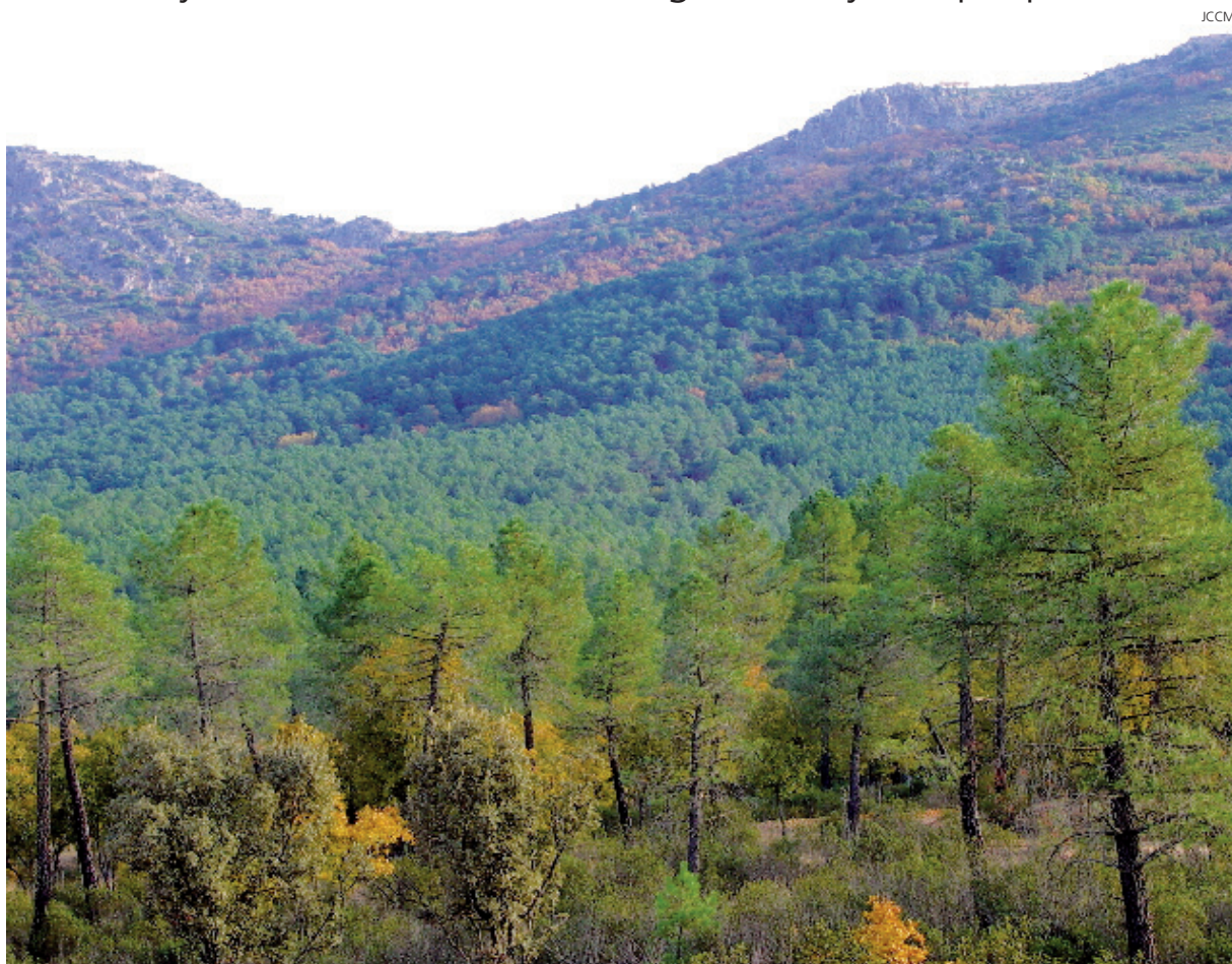
El Parque Natural de Sierra Madrona es la primera vez que se acoge a estas ayudas.

Municipios de la Sierra Norte de Guadalajara, Parque Natural de Sierra Madrona y del Valle de Alcudia, se acogen a las ayudas por primera vez