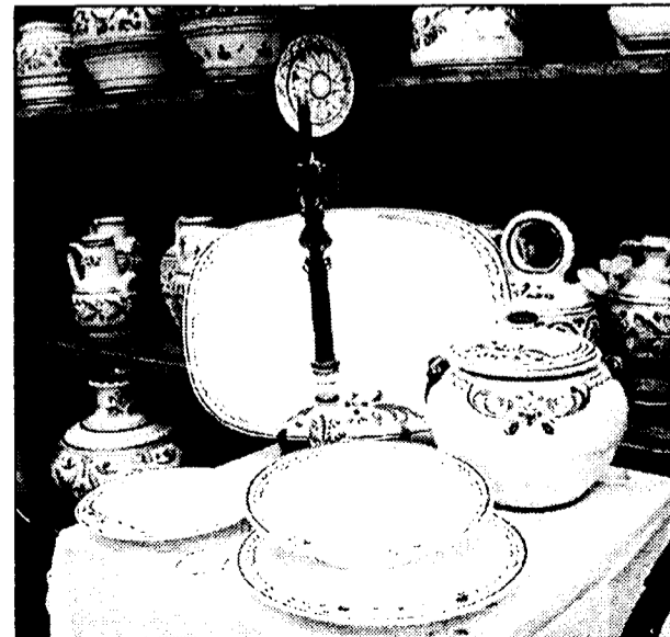
El comercio requiere ayuda a su medida para la adaptación.

Por ello, los representantes de la Confederación en el Observatorio del Euro han propuesto, de nuevo, la toma en consideración de esta iniciativa, mediante la que se apoyaría a las empresas.