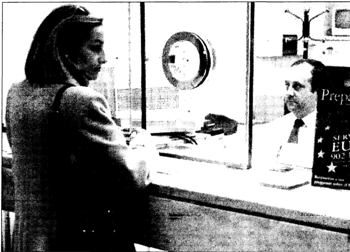
La Ley de introducción al Euro se basa en el principio de neutralidad, equivalencia y continuidad.

Durante el período transitorio, los particulares podrán optar por redenominar las cuentas