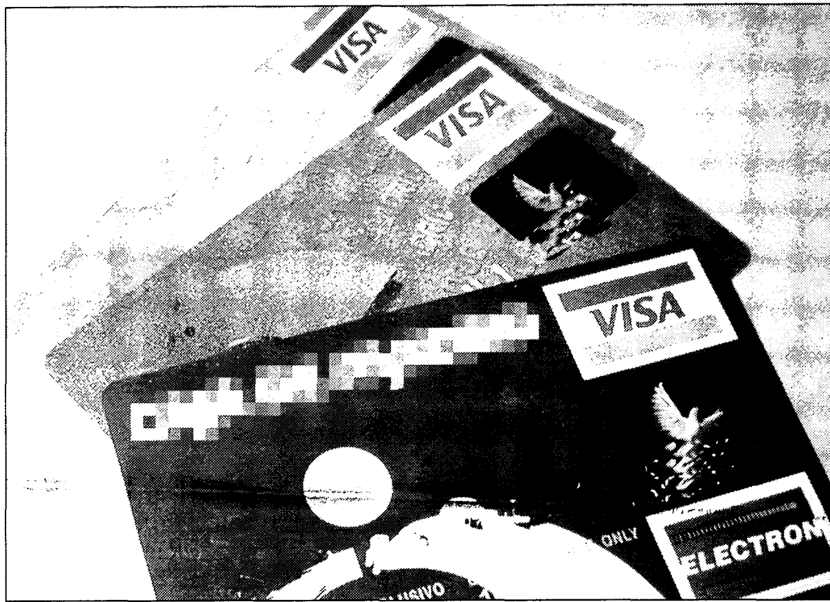
Las transferencias y los pagos con tarjeta se verán beneficiados a medio y corto plazo.

Con este sistema, la liquidación de pagos se hará en términos brutos y en tiempo real, es decir, la orden de pago sólo se transmitirá si existen fondos o crédito con garantía en la cuenta del ordenante, y se abonará en la cuenta del beneficiario tan pronto como se reciba la orden de