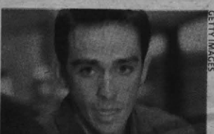
Contador ya piensa en Pekín.