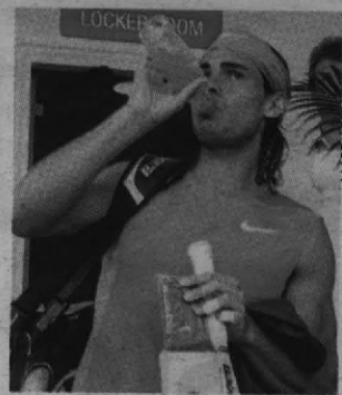
Nadal se refresca antes de jugar la final de Queen's.