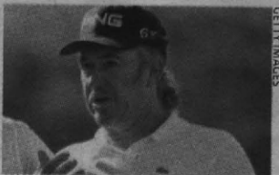
El español falló al final.