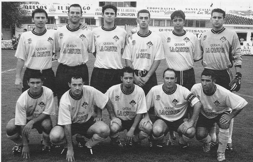
CF La Solana 2002-2003.

La afición ha respondido al hábil señuelo de la Junta Directiva: carnets de socio a mil duros. Hay alrededor de 300, el triple que el año pasado, pero en realidad los mismos que en otros tiempos no tan lejanos. Sin echar cohetes, es