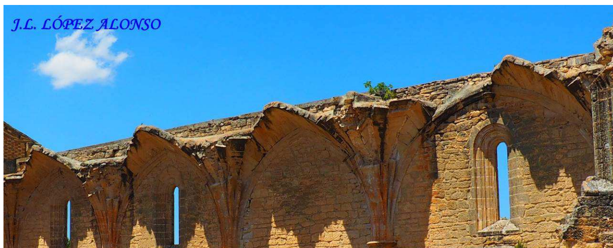
La bóveda estrellada del Rosal, cuyos nervios parten de las columnas laterales