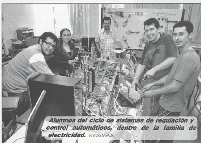
Alumnos del ciclo de sistemas de regulación y control automáticos, dentro de la familia de electricidad.