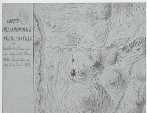
Fig. 36. Croquis del castillo de Castellar