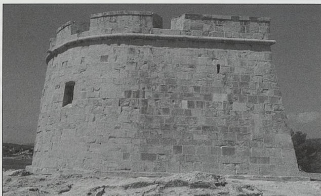
Fuerte de Moraira. Teulada

Fuerte de Moraira: situada en el término de Teulada, también figura como castillo de Morayra o de Almoryra , se extendía entre el cabo de Moraira y el cabo Blanco .