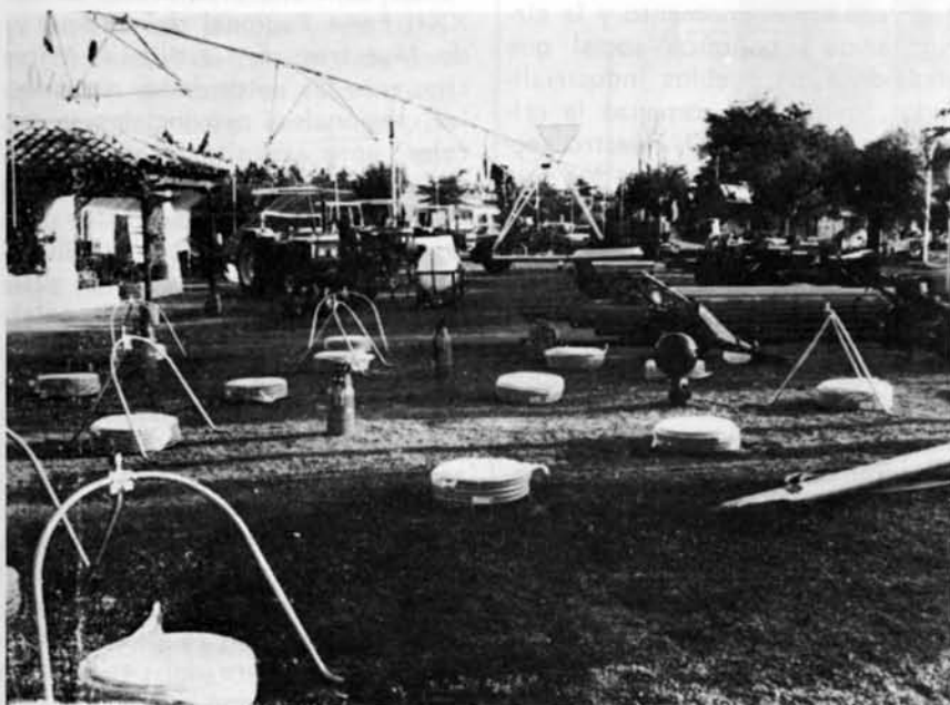
Las instalaciones de regadío, en primer plano de esta vigésima segunda edición de la Feria.