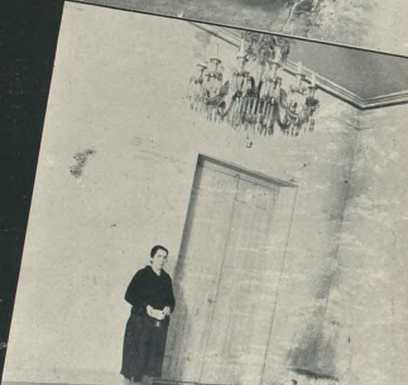
de la calle de Serrano, Madrid, en donde vivía José Antonio, verdadero templo de España, en el que toda familia se arriesgó colab... Biblioteca Virtual de Castilla-La Mancha. Y. revista para la mujer nacional-indianista. #16. 5/1939.