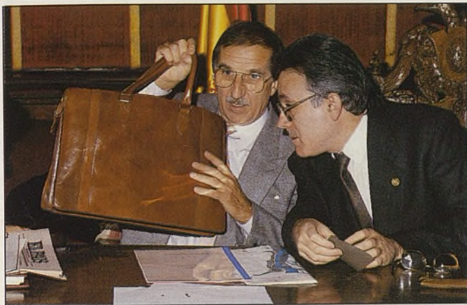
Winkler entregó su trabajo sobre el tráfico en el casco y las medidas tomadas, que provocaron la dimisión del concejal poco tienen que ver con este estudio.