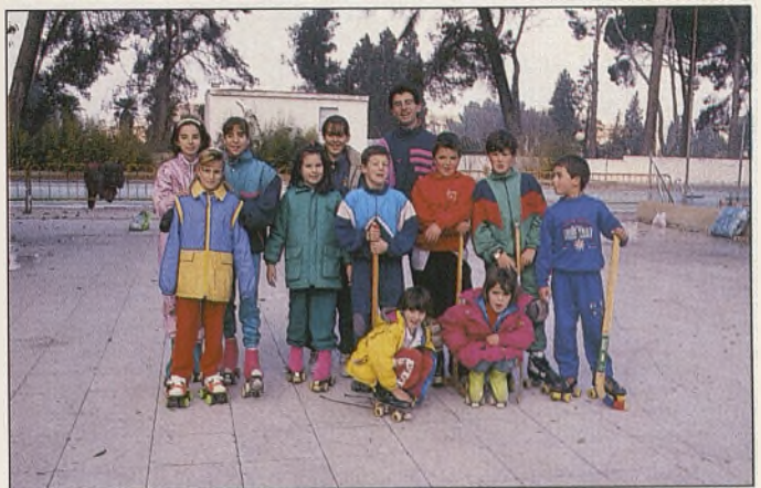
La Asociación de Amigos del Parque Escolar, que acaba el año organizando para las Navidades diferentes actividades culturales, tendrá buenos recuerdos del 92 porque fueron oídas sus reivindicaciones, al emprender el Ayuntamiento su limpieza.