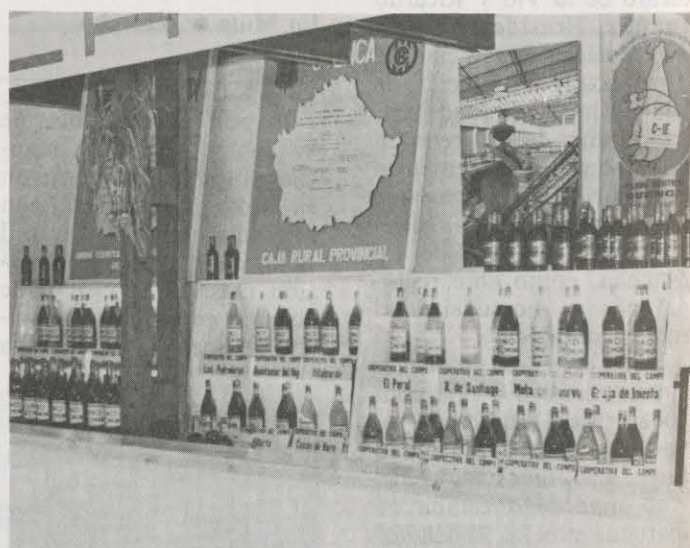
SOLUCIONES PARCIALES NO ARREGLARÁN EL PROBLEMA

acuerdo de solicitar, reglamentariamente, una reunión de la región manchega, con todos los representantes sindicales provinciales y con asistencia de los nacionales correspondientes, para establecer una línea de actuación.