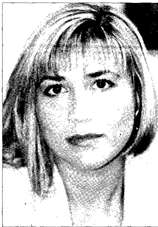
LÍDERES Julia Otero triunfa en la tarde e Iñaki Gabilondo en la mañana.

En el terreno informativo la Cope destaca con los 770.000 oyentes de 'La linterna'. Carlos Llamas —'Hora 25'—, Concha García Campoy y 'La Brújula' de Onda Cero y '24 horas' de RNE1 con Manuel Antonio Rico, siguen detrás.