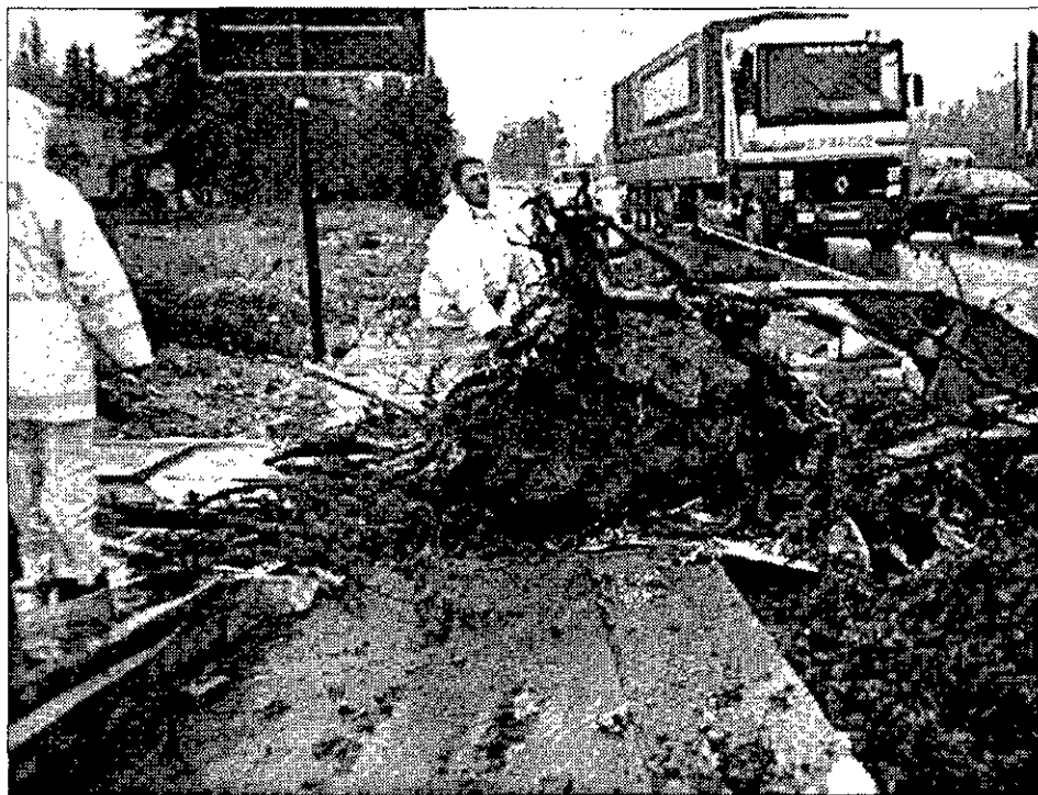
ARRASADOR Aspecto que tenían ayer algunas calles de Badajoz, afectadas por el temporal de lluvia y viento.

El temporal se traslada hacia el Mediterráneo y afectará hoy a las Baleares, con lluvias ocasionalmente tormentosas y moderadas en el cuadrante noreste peninsular, según las predicciones del Instituto Nacional de Meteorología.