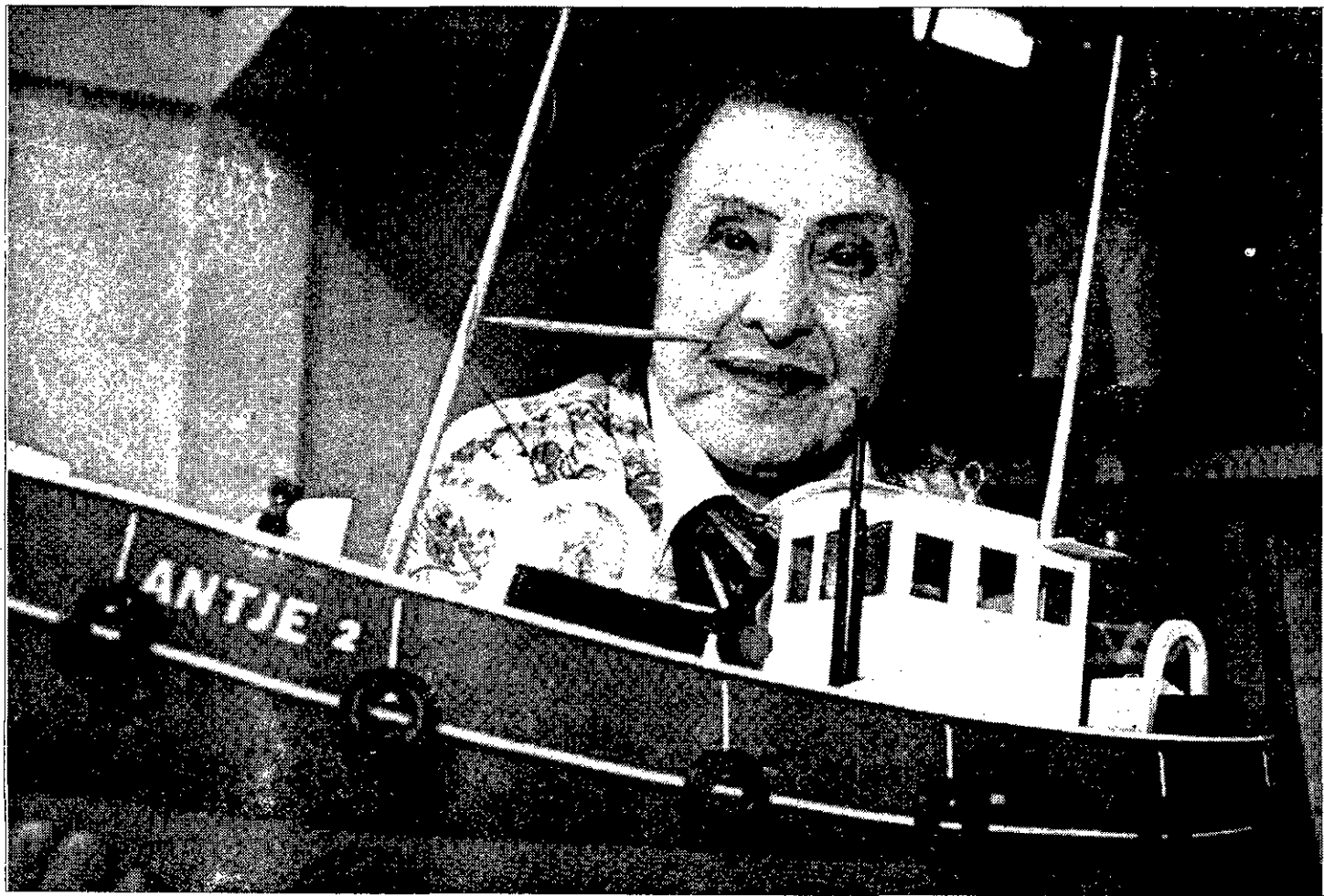
CONTI Imagen de la bióloga y exploradora de los mares.

Sobre sus prioridades al frente del Programa Nacional Antártico, que calificó de modesto aunque suficiente, Jerónimo López, indicó que intentará potenciar la coordinación entre los grupos científicos españoles así como a nivel internacional, y recordó la labor realizada por sus predecesores en el cargo.