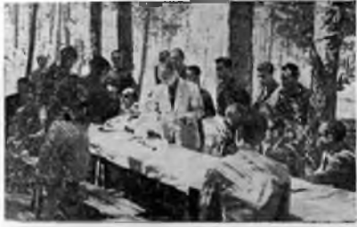
El Jefe Provincial del Movimiento, en el momento de entregar los títulos de mando, a los nuevos Jefes de Escuadra.