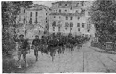
El segundo turno del Campamento, desfila por la capital el día de la Clausura después de efectuar la marcha a Cuenca.