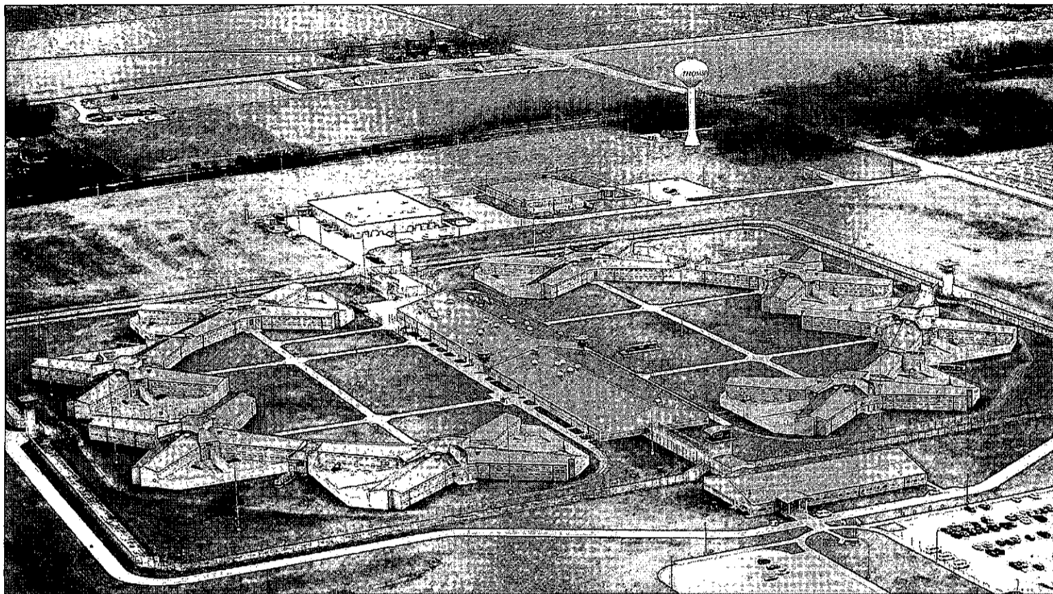
Vista aérea de la prisión de Thompson, en Illinois, que será empleada por Obama para albergar a varios presos procedentes de Guantánamo.